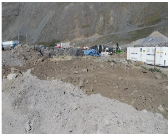
Fotografía 3: Coordenada Este 398571, coordenada Norte 6272527; Huso 19.