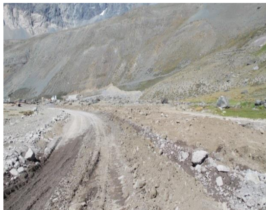
Fotografía 4: Coordenada Este 398426, coordenada Norte 6272447; Huso 19.