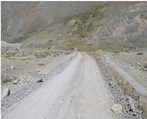
Fotografía 1: Coordenada Este 398367, coordenada Norte 6272493; Huso 19.