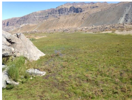
Fotografía 6: Coordenada Este 398465, coordenada Norte 6272407; Huso 19.