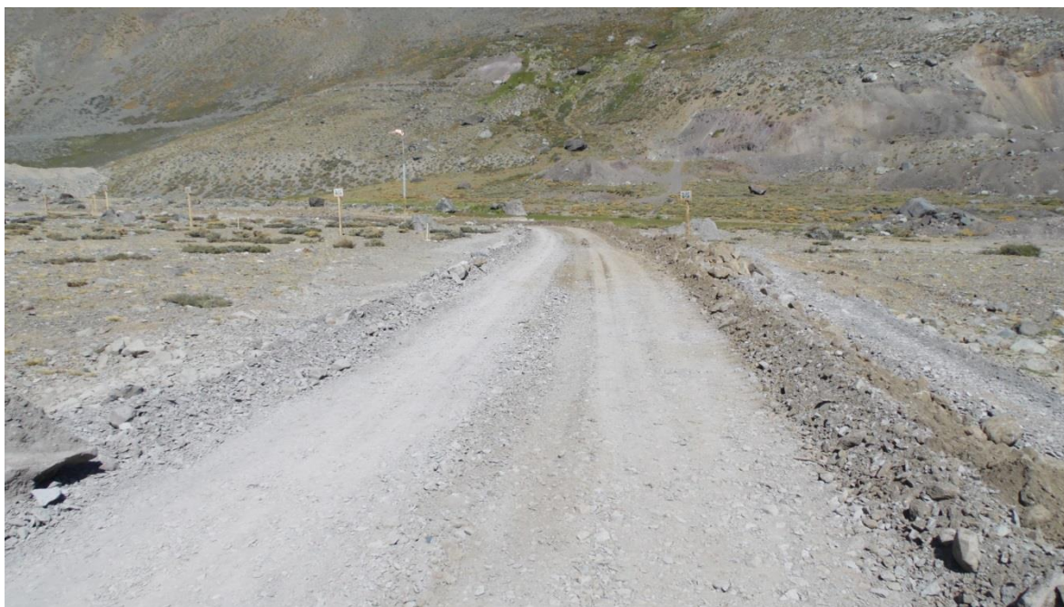
Fotografía 4: Coordenada Este 398373, coordenada Norte 6272486; Huso 19.