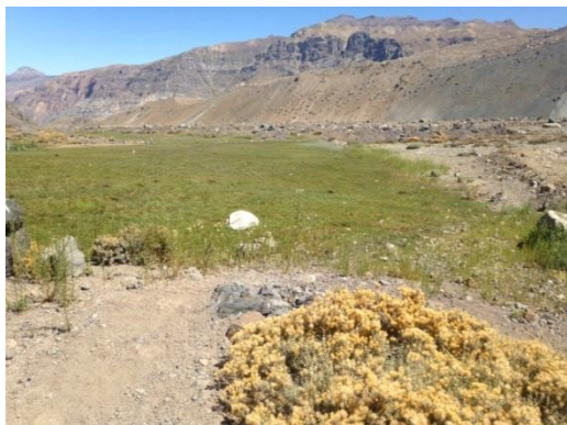
Fotografía 5: Coordenada Este 398466, coordenada Norte 6272419; Huso 19.