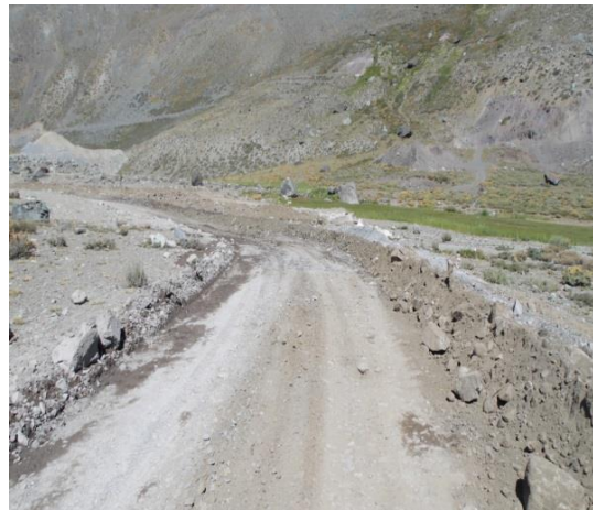
Fotografía 2: Coordenada Este 398388, Coordenada Norte 6272471; Huso 19.